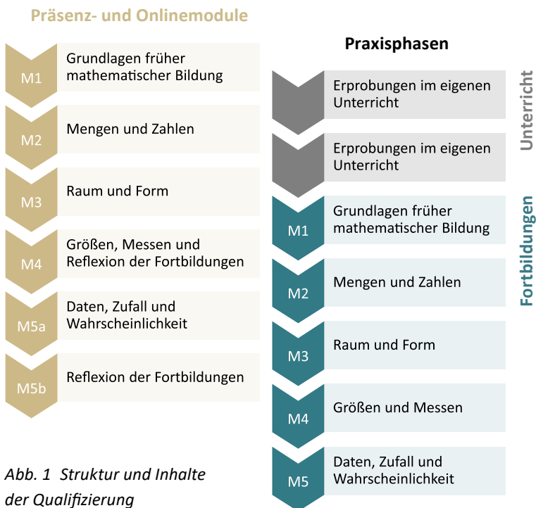
Abb. 1 Struktur und Inhalte der Qualifizierung

Ab dem zweiten Jahr der Qualifizierung führen die Multiplizierenden Fortbildungen durch. Die Fortbildungen können mit einzelnen Fachschulen erfolgen (in Schulteams) oder mit Lehrkräften aus mehreren Fachschulen, die in einem Netzwerk zusammenarbeiten (in Schulnetzwerken). Für die Praxisphasen werden den Multiplizierenden erprobte Unterrichts- und Fortbildungsmaterialien zur Verfügung gestellt (Hintergrundtexte, Präsentationsfolien, Arbeitsmaterial, Praxisvideos).